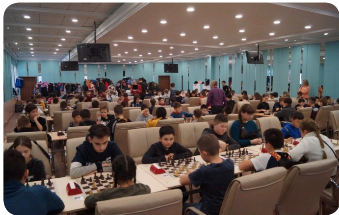
Турнир по шахматам «Кубок Академии здоровья» г.