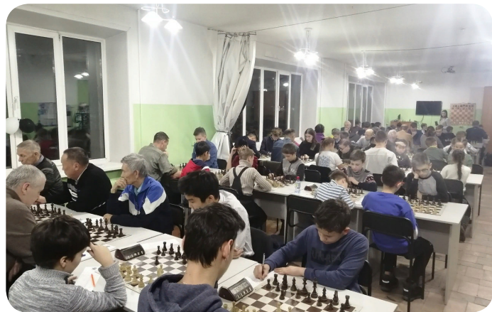
Чемпионат Забайкальского края по классическим шахматам г. Чита